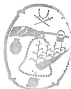
Municipio de Tlajomulco de Zúñiga, Jalisco DIRECCIÓN DE PATRIMONIO MUNICIPAL