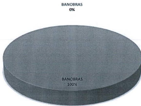
DISTRIBUCIÓN DE LA DEUDA