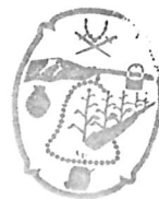
Municipio de Tlajomulco de Zúñiga, Jalisco DIRECCIÓN DE PATRIMONIO MUNICIPAL